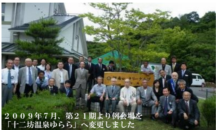
2009年7月、第21期より例会場を「十二坊温泉ゆらら」へ変更しました