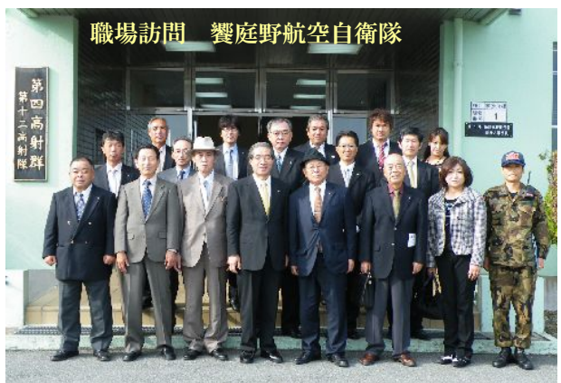
職場訪問 饗庭野航空自衛隊