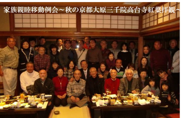
家族親睦移動例会～秋の京都大原三千院高台寺紅葉拝観～