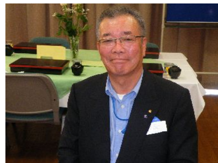
水口ロータリークラブより