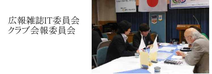
広報雑誌IT委員会 クラブ会報委員会