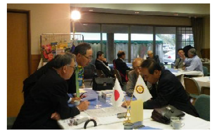
職業分類・会員選考 委員会 会員増強委員会