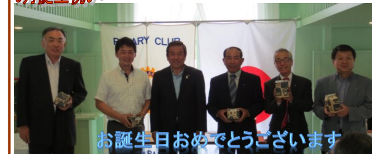
お誕生日おめでとうございます