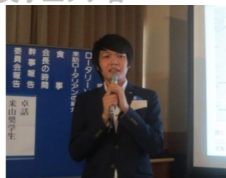
卓話ありがとうございました。今後もご活躍お祈り申し上げます。