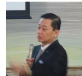
野村会員、卓話と健康診断ありがとうございました。