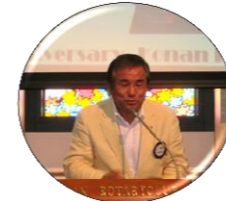
上西保会員 20年連続