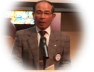
中川国際奉仕委員

・10/12湖南チャリティーフェスティバルを行いました。多くの市民にご参加頂き、また、沢山のチャリティーも頂くことが出来ました。ご協力ありがとうございました。