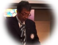
青木社会奉仕委員

・湖南チャリティーフェスティバルの献血には予定以上の80名の方に、ご協力頂きました。ありがとうございます。 ・3/3健康診断 ・3/17-18名古屋へ家族親睦旅行(トヨタへの研修旅行)多くのご参加をお願いします。