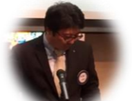
平松青少年奉仕委員

・湖南チャリティーフェスティバルに共同事業として台北府門RCより9名お越し頂きました。 ・4月に台湾での共同事業 ・6月に会長交代式 ・国際協会との事業