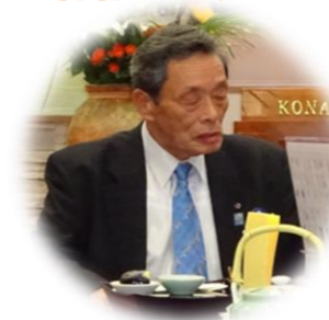
ガバナー補佐 川嶋正昭